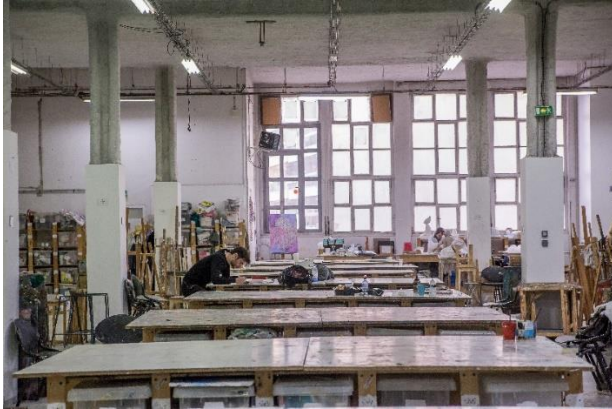
Le 100 ecs

Le 100 Etablissement Culturel Solidaire (100 ecs ) 100 rue de Charenton 75012 Paris Tel : 01 46 28 80 94 Email : accueil@100ecs.fr