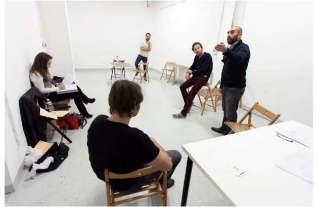
Le 100 ecs