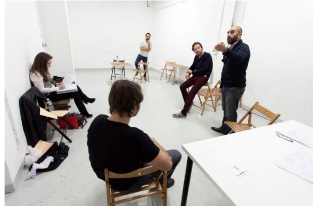
Le 100 ecs