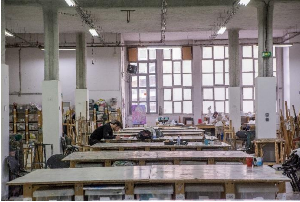
Le 100 ecs

Le 100 Etablissement Culturel Solidaire (100 ecs ) 100 rue de Charenton 75012 Paris Tel : 01 46 28 80 94 Email : accueil@100ecs.fr